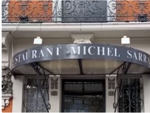
Gers Développement lance sa chaîne de podcasts