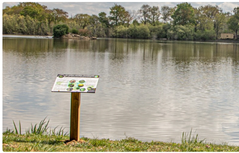
6 Pupitre au bord de l'étang du Moura 1bis 120421.jpg