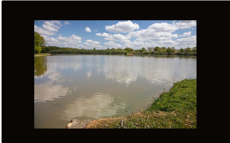
Appel d'offres pour aménager une parcelle de la rive du Moura (Avéron-Bergelle)

Dans le cadre de l'Éducation à l'environnement et au développement durable