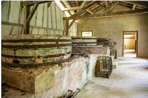
La salle des meules