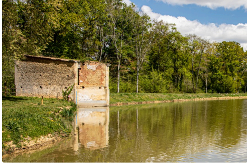
Antique cabane de pêche