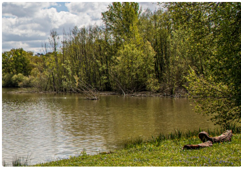
5 Au bord de l'étang du Moura 1bis 120421.jpg