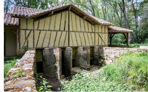
Le même sous un autre angle