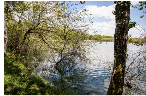
7 Au bord de l'étang du Moura 1bis 120421.jpg