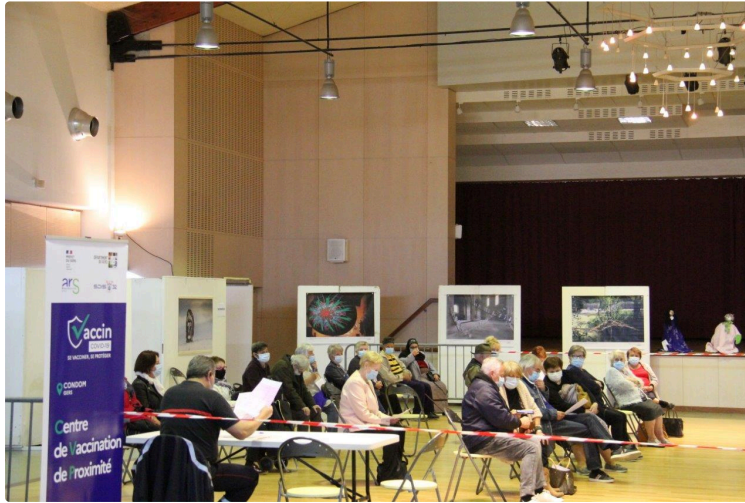
La routine s'installerait presque....

Pour cette deuxième semaine avec deux jours entiers de vaccination, la coopération entre les différents intervenants fonctionne de mieux en mieux.