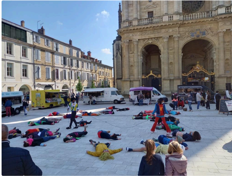
Lors de sa balade, le piéton trébuche sur deux "manifs"