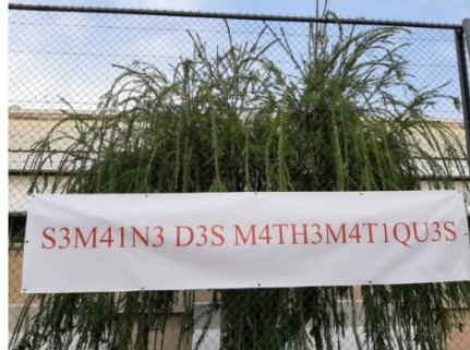
Semaine des mathématiques : les solutions !