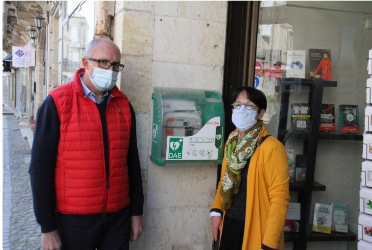
Pouvoir sauver une vie à toute heure du jour et de la nuit

Grâce au premier défibrillateur installé en extérieur