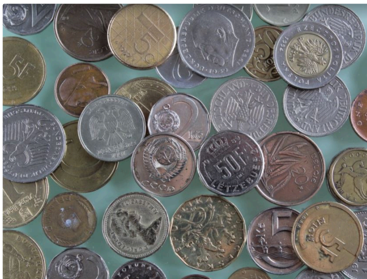
Possédez-vous un Krugerrand d'Afrique du Sud ?

Cherchez bien ! Il s'agit de faire vos fonds de tiroir. C'est fou ce qu'on peut y trouver ! Une petite pièce peut avoir une grande valeur. Ce serait dommage de passer à côté d'un vrai trésor.