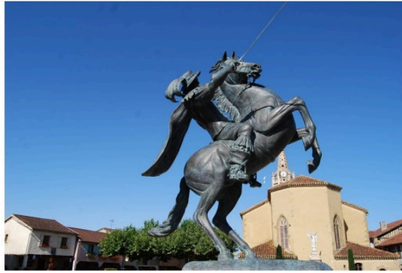
Après la télévision, le cinéma ! D'Artagnan, le héros local, de nouveau à l'honneur

Le docu-fiction diffusé sur Arte samedi 10 avril et encore disponible en cliquant ici , avait mis en lumière le véritable d'Artagnan qui a inspiré à Alexandre Dumas son héros de fiction.