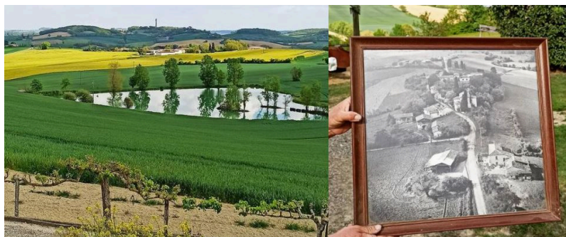
Peyrusse-Massas : une vue à couper le souffle et quels reflets dans l'eau !