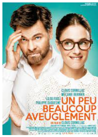
Bande annonce Un peu, beaucoup, aveuglement