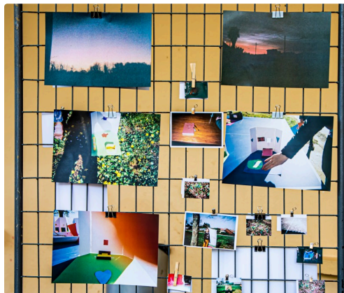
Une des grille avec photos faites par les enfants

(1) Plus de détails dans l'article ( https://lejournaldugers.fr/article/48325-les-enfants-de-lecole-du-houga-devoient-leur-espace-personnel ).