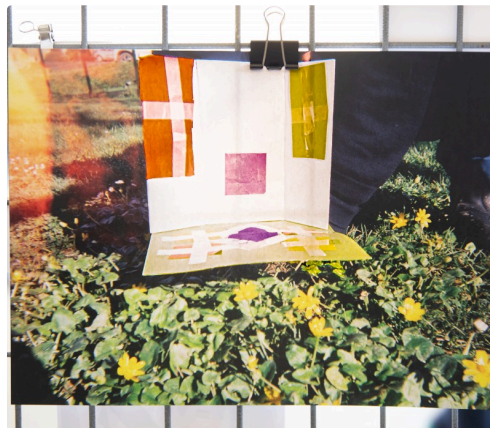
Photo de maquette de lieu personnel