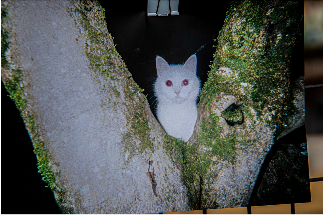
Photo faite par un enfant dans son endroit personnel