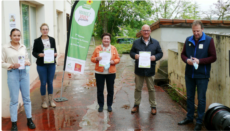
"Le printemps à la ferme" innove via les réseaux sociaux

L'édition du « Printemps à la ferme », édition 2021 se déroulera d'une manière inédite. Car pour la première fois « Bienvenue à la ferme » proposera du 13 mai au 24 mai des vidéos-interviews de présentations de fermes via les réseaux sociaux https://www.instagram.com/bienvenue_ala_fermeg/ et https://www.facebook.com/bienvenueàlaferme.gers