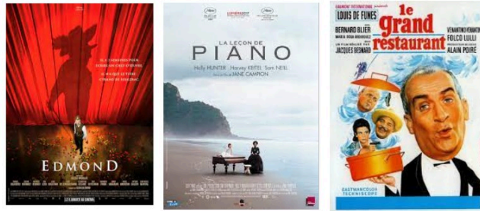
Drame ou comédies dimanche soir

Trois films de registres très différents à vous proposer pour votre soirée de dimanche.