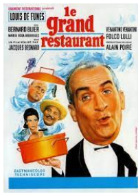
Bande annonce Le Grand Restaurant