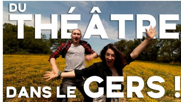
Escale dans le Gers pour le tournage du film "Rideau"