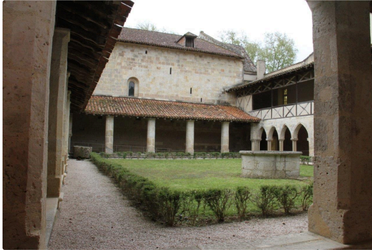
Flaran - Castelmore : vers un destin similaire ?

Les lieux culturels ouvrent à nouveau à compter du mercredi 19 mai : l'abbaye de Flaran aussi