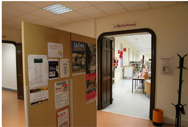
Des nouvelles de la Médiathèque