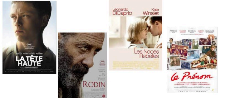
Comédie, drames et biopic jeudi soir...