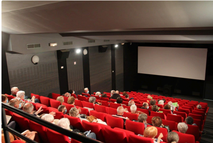
Les portes du Gascogne se sont ouvertes

Les lumières de la ville éclairent à nouveau. La séance peut débuter !