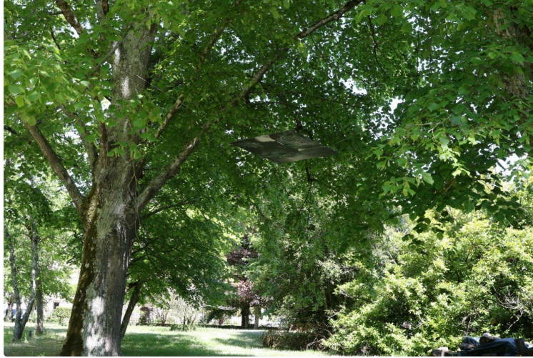
Vernissage d'exposition dans la sous-préfecture

Les Chemins d'Art en Armagnac sont les premiers à ouvrir le bal !