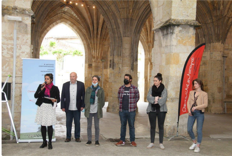
Une coïncidence bienvenue

L'ouverture de la 11e édition des Chemins d'art en Armagnac