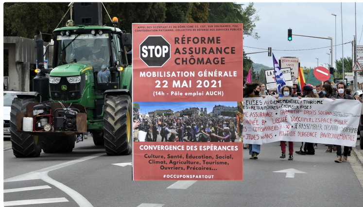
Manifestation unitaire contre la réforme de l'assurance chômage

À l'appel des occupants de Ciné32- CIRCA, de SUD/SOLIDAIRES, CGT, FSU et de la confédération paysanne une manifestation était organisée cet après-midi au départ de pole emploi pour se terminer place la République, mais elle s'arrêtera dans la joie sur une terrasse de l'escalier monumental (voir photo plus bas). Le groupe toulousain " graines de sel " animait le cortège.