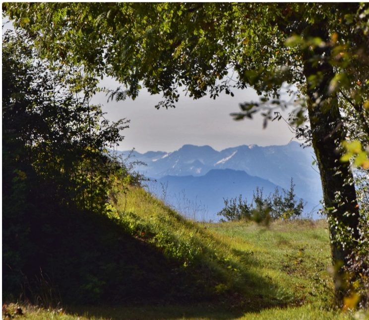
De circuits à itinéraires PR il n'y a qu'un pas

Sous l'égide de la communauté de communes Astarac Arros en Gascogne