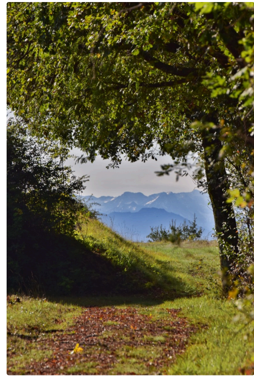
Les Pyrénées encadrées