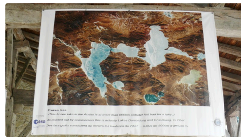
Lacs gelés du Tibet à 5 000 mètres d'altitude.