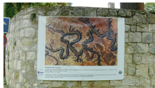
Méandres de la rivière Colorado.