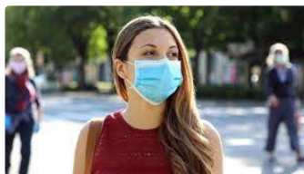
Le port du masque toujours obligatoire en extérieur dans 22 villes du département