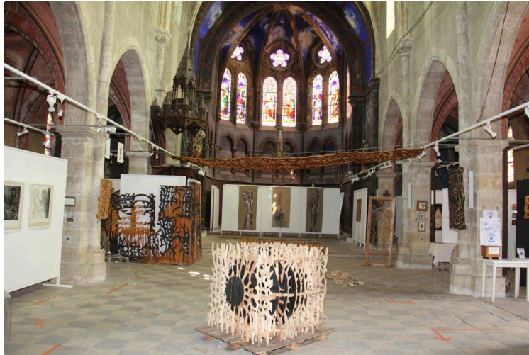
L'Espace Saint-Michel s'anime à nouveau

La saison est bien lancée, le public est déjà au rendez-vous grâce à quatre artistes à découvrir jusqu'au 27 juin