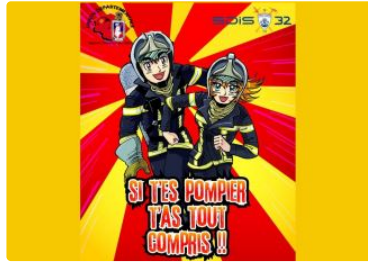
Recrutement de jeunes sapeurs-pompiers pour la rentrée