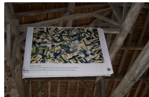
Fields in Aube ( également sous la halle )