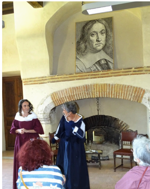
La soeur et l'épouse Fermat en pleine discussion.