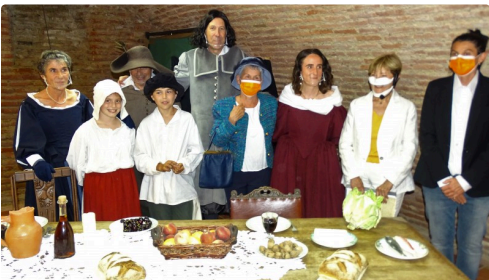
La troupe au complet avec la présidente-guide.