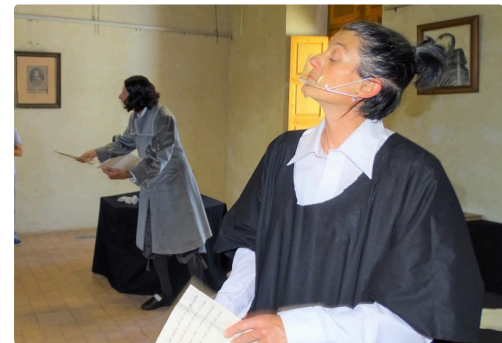
La dispute Fermat-Descartes.