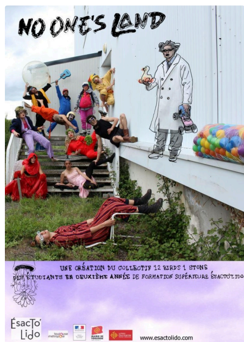
No one's land ©Esacto'Lido.jpg

Entre deux mondes est une pièce pour 5 danseurs acrobates et 1 chanteuse/comédienne, qui mêle le chant, la magie nouvelle, la danse verticale et la voltige. Telle une petite humanité, ce groupe se retrouve embarqué dans une épopée acrobatique et lyrique à travers le temps. Dans un monde qui bouge et les repousse, le collectif s'adapte, tente de garder l'équilibre avant que tout bascule. Une histoire de place, de liens, de gravité.