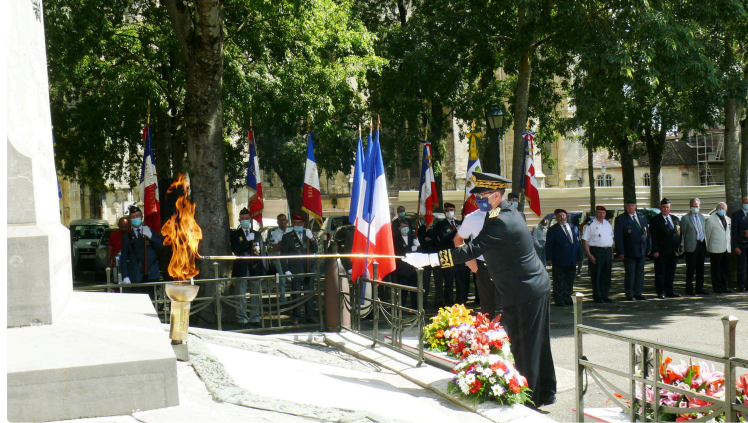
Commémoration de l'appel du 18 juin 1940

A l'occasion du 81ème anniversaire de l'appel à la résistance du Général Charles de Gaulle lancé depuis Londres le 18 juin 1940, une cérémonie s'est déroulée vendredi matin au monument aux morts d'Auch. Il s'agissait de se souvenir de l'appel lancé sur les ondes de Radio-Londres où le Général de Gaulle appelait les Français à refuser la défaite et à poursuivre le combat aux côtés de nos alliés Anglais qui résistaient vaillamment aux armées hitlériennes.