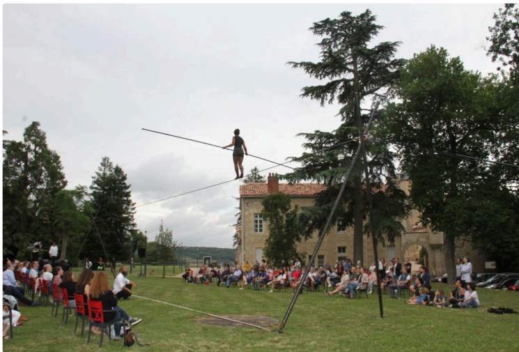
Les Côtes de Gascogne s'envolent pour tout l'été

Avec la première édition d'un événement œnotouristique