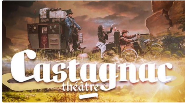
En avant-première, une déambulation dans le cadre de Vineart 2021

Un spectacle gratuit et une exclusivité coproduite par La Boîte à Jouer