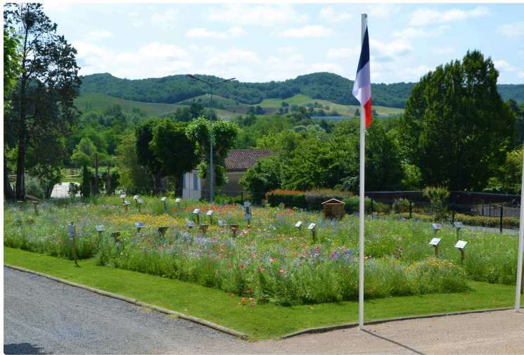
De nouveaux sites fleuris sur la commune