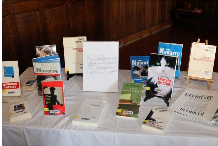
Le troisième opus des œuvres complètes d'Yves Navarre en préparation

Participez à sa sortie prévue en novembre prochain !