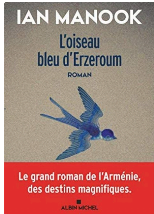
marciac oiseau bleu.JPG