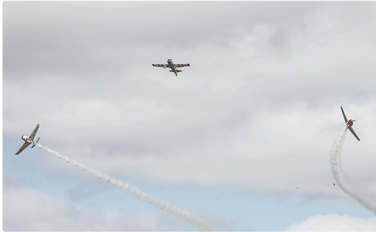
Voltige à l'Aéroclub du Bas-Armagnac de Nogaro

Un spectacle rare se prépare à Nogaro. L'Aéroclub du Bas-Armagnac, en coopération avec avec Midi-Pyrénées Voltige (MPV), organise des Journées Voltige du jeudi 1er juillet au samedi 3 juillet – dès le matin - à l'Aéroclub du Bas-Armagnac à Nogaro. Deux avions biplaces seront présents, un Mudry CAP 10 et un Extra 200.