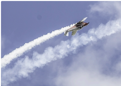
12 Gros plan sur le 2e 1 160417.jpg