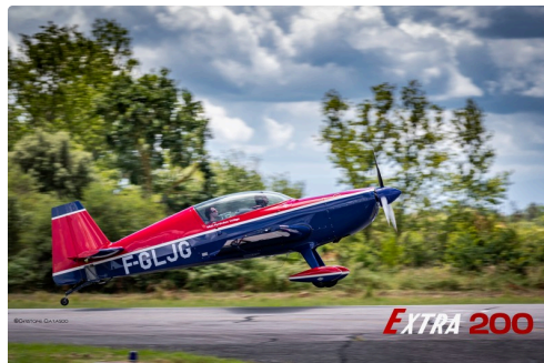
Extra 200