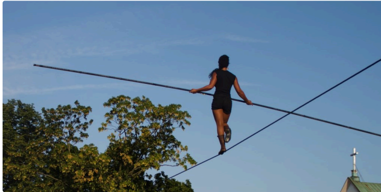
CIRCA présente Les échappées d'été

des spectacles, des rencontres, des ateliers... gratuits