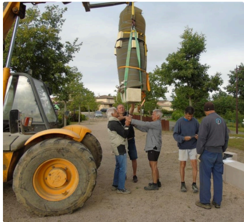
Un travail de précision