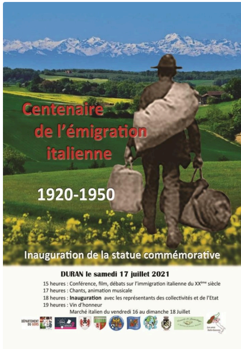
inauguration recto (1).jpg