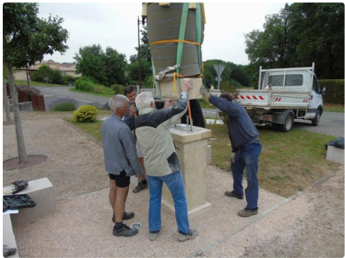
qui ne tolère pas