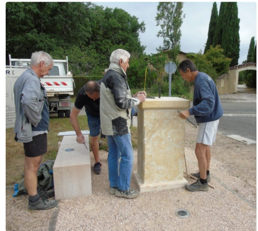
de fausse manoeuvre