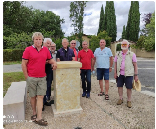
Les acteurs de la mise en place de la statue