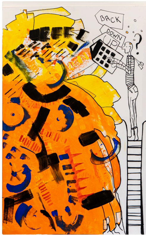
7 Nam Tran tableau 1bis 020721.jpg