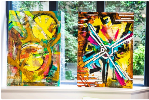
5 Nam Tran ces tableaux vont être accrochés 1bis 020721.jpg