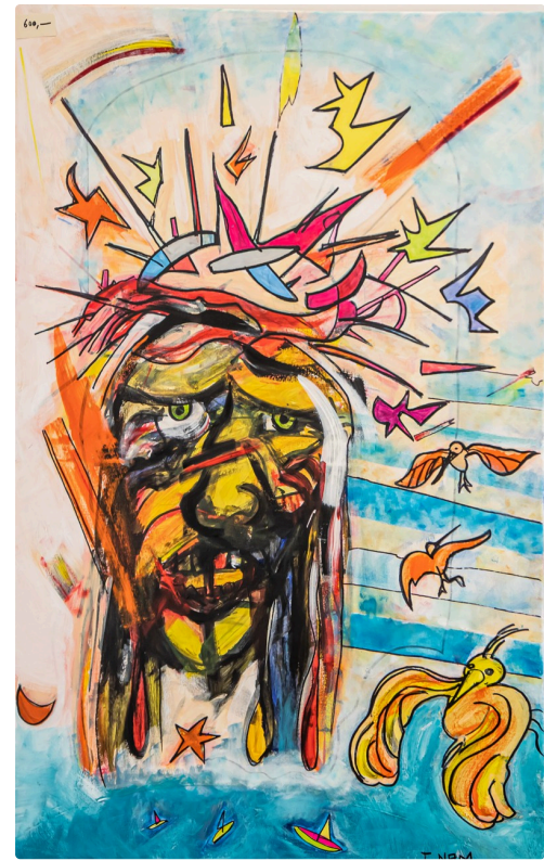
8 Nam Tran tableau 1bis 020721.jpg