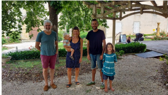
Les Petits Marchés des Soirs d'Été, ça commence mercredi 7 juillet !