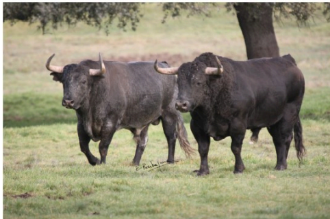
Toros en Vic : corrída du dimanche matin 11 h

Nous poursuivons notre présentation de la feria del toro 2021 avec la corrída du dimanche matin 11 h.