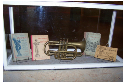
nuit des musées et expo Claude Augé 004.JPG