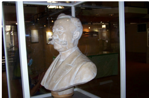
Sculpture de l'illustre Claude Augé