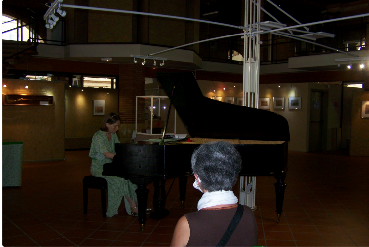
Exposition estivale et Nuit des Musées animent le Musée Campanaire-Espace Pierre Lasserre

" Claude Augé, un lillois aux multiples talents"