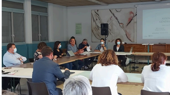
Assemblée Générale de l'Office de Tourisme d'Artagnan en Fezensac : une année 2020 difficile mais des projets ambitieux en 2021