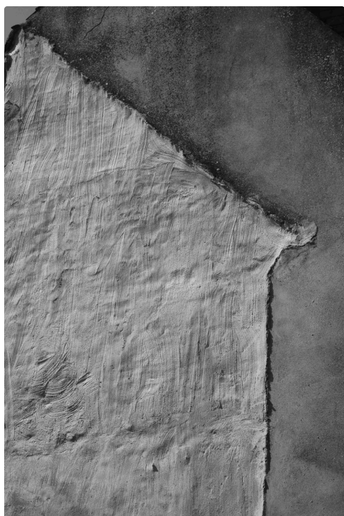
la mémoire à fleur de peau de Mythos de Nia Diedla