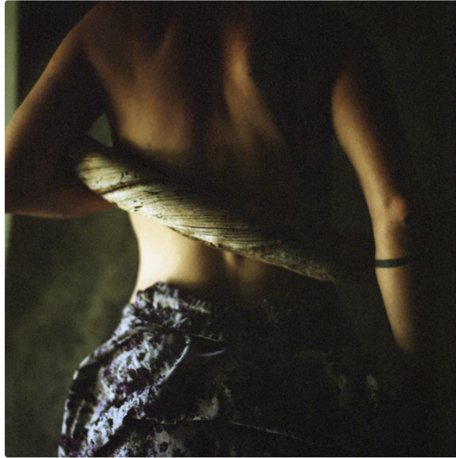
A Lecture et alentours, l'été sera photographique

Après une année 2020 un peu triste, voici une édition aussi enrichissante que baladeuse dans plusieurs lieux patrimoniaux de Lecture et à deux pas