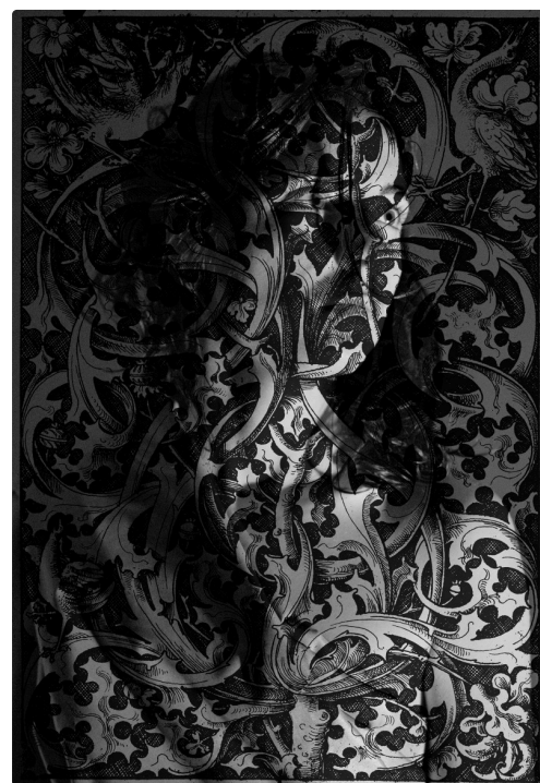
Anima Obscura de Thomas Cartron