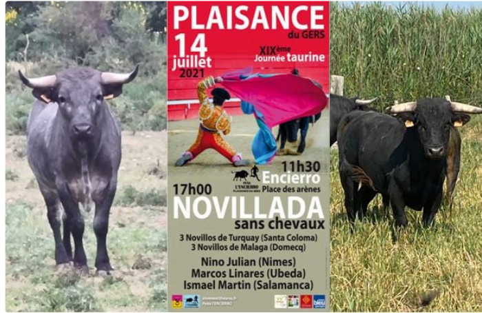
Les Novillos du 14 juillet sont choisis

Les Présidents de Vivement 5 Heures nous disent tout