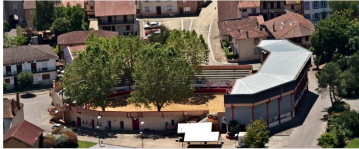
Boleros et pantalons blancs de retour dans les arènes de Nogaro !

Mercredi 14 juillet à 17 h 30, les arènes Robert Castagnon vont revivre au son de la Cazérienne.