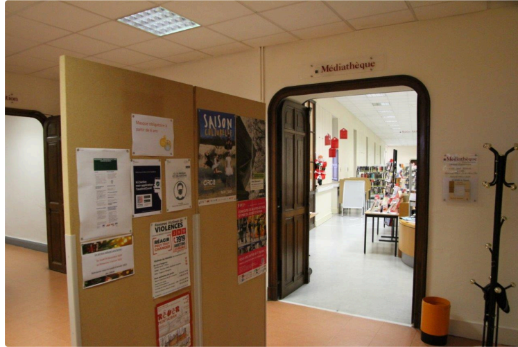
Des nouvelles de la Médiathèque

Pour l'été, les bibliothécaires vous proposent un vaste choix de lecture