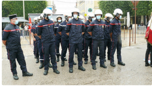
Délégation de pompiers.