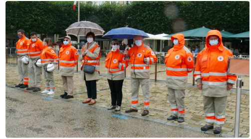
Délégation de la Croix Rouge.