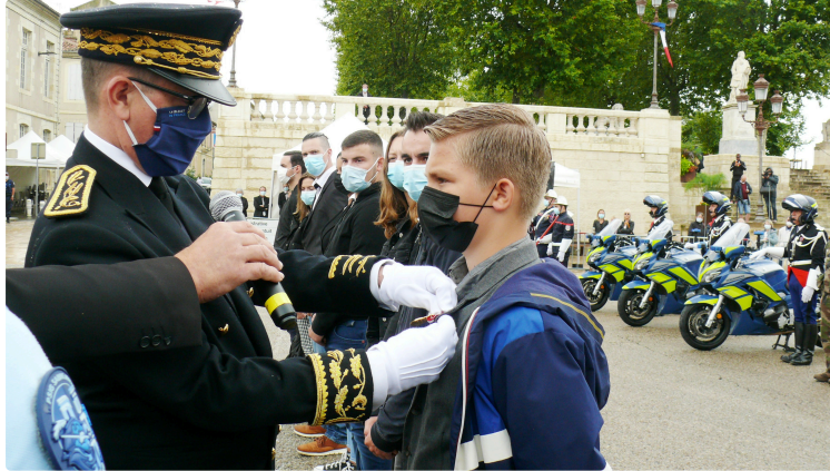
14 juillet : presque pas de public mais la solennité de la cérémonie était là

Décidément ce 14 juillet ne pouvait avoir l'éclat qu'on lui a connu auparavant. Une pluie froide et persistante, les deux rafales qui ne survoleront pas la ville, et l'attrait du Vaccin'Drive avec son millier de personnes, sont probablement les raisons de retrouver une place de la Libération quasiment vide de publics.