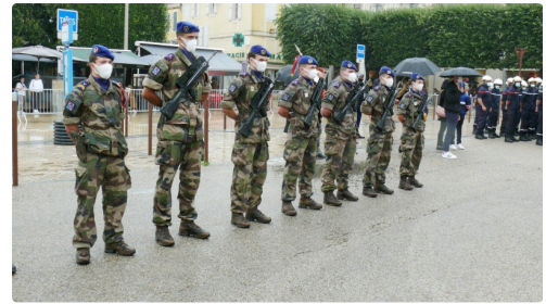
Un peloton du 5ème régiment d'hélicoptères de combat de Pau.