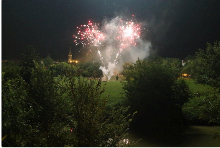
Histoire presque sans paroles

Profitez du spectacle gratuit que les Condomois ont pu admirer en cette soirée du 14 juillet 2021 !