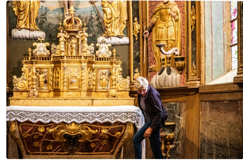
Le maître- autel dont les guides aînées ont lavé la nappe